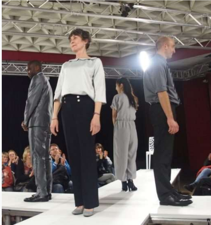
Les comédiens et les spectateurs se saluent.